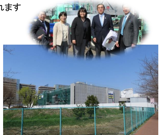
工事が進む新給食センターへ現場見学