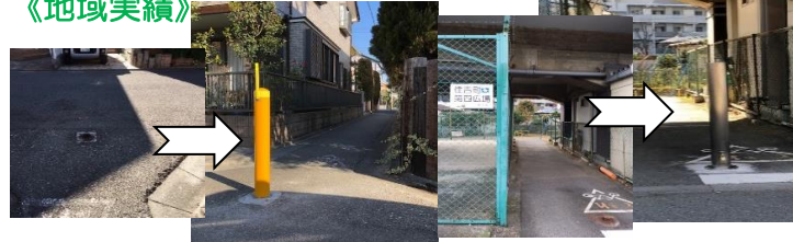
四谷1丁目通学路 《車止め設置》 住吉町